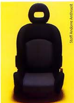
Stoff Andorre Anthrazit