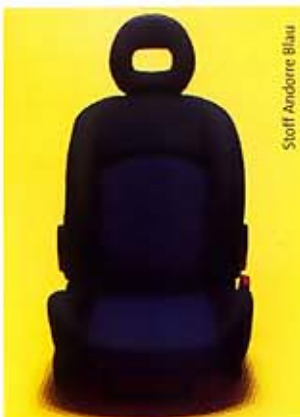
Stoff Andorre Blau