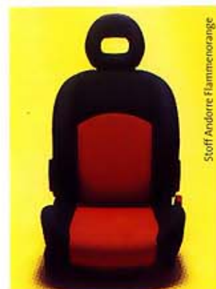
Stoff Andorre Flammenorange