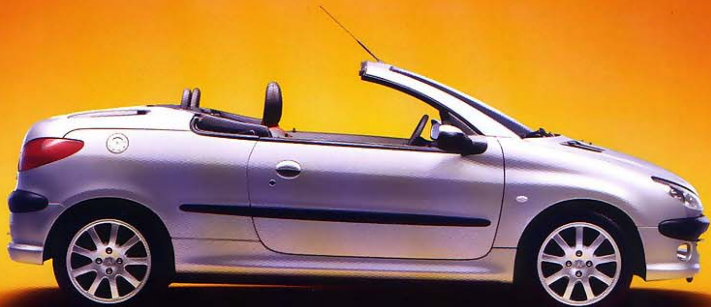
Abbildungen und Beschreibung: 206 CC Platinum

Die Informationen und Abbildungen dieser Broschüre entsprechen dem technischen Stand zum Zeitpunkt der Drucklegung. Je nach Version sind die abgebildeten Ausstattungsdetails serienmäßig oder als Sonderausstattung erhältlich. PEUGEOT behält sich Änderungen dieser Unterlage vor, z.B. im Hinblick auf technische Daten, Konstruktion, Material und das äußere Erscheinungsbild. Ihr PEUGEOT Händler informiert Sie gerne über etwaige Änderungen.