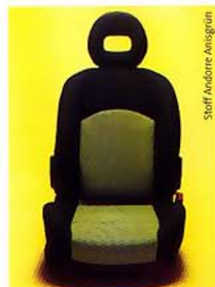
Stoff Andorre Anisgrün