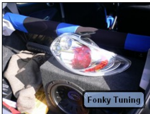
Abb.3 Zeigt einzubauende Lampe

Als Erstes sucht man sich aus dem riesigen Angebot ein schönes, qualitativ hochwertiges Produkt aus. Diese finden wir hier im Forum unter Links oder bei french-power.com. Da ich als Schüler leider zu wenig Geld habe, bin ich auf Ebay umgestiegen. Fehlschlag, wieso erzähle ich nachher.