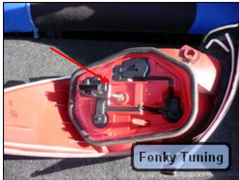
Abb.7 Zeigt original Lampenglas

Ich habe aus der originalen Lampe einfach die ganzen Birnen ausgebaut und diese in meiner Klarglaslampe verbaut. Hier muss man auf richtiges Positionieren der Lampen achten. Dürfte aber in der Regel kein Problem darstellen. Blinker oben, Rücklicht unten.