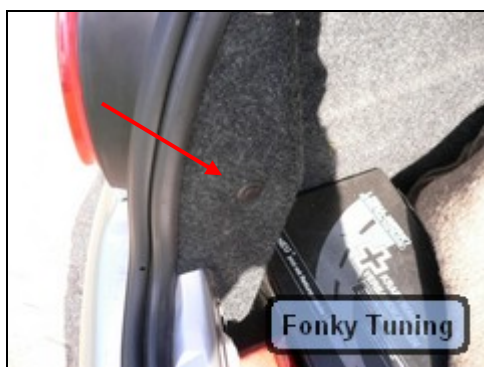
Abb.5 Zeigt Halterung

Als Erstes muss die Originallampe ausgebaut werden. Dazu muss zuerst im Kofferraum die Halterung des Teppichs entfernt werden. Dann kann man von Innen an die Lampe heran.