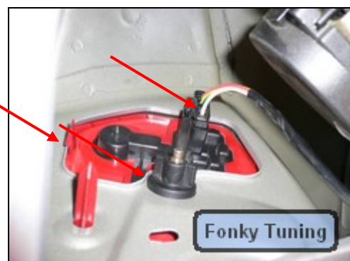
Abb.6 zeigt Lampe (innen)

Um die Lampe heraus zu bauen, muss erst (siehe Abb.6) die Flügelschraube geöffnet werden, dann der Stromstecker abgeklemmt werden, und zuletzt die Haltenase heruntergedrückt werden. Dann kann man die komplette Lampe nach hinten heraus ziehen.