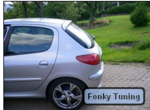
Abb.2 von seitlich vorher

Als Erstes sucht man sich aus dem riesigen Angebot ein schönes, qualitativ hochwertiges Produkt aus. Diese finden wir hier im Forum unter Links oder bei french-power.com. Da ich als Schüler leider zu wenig Geld habe, bin ich auf Ebay umgestiegen. Fehlschlag, wieso erzähle ich nachher.