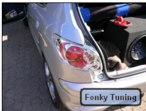
Abb.9 zeigt Lampe