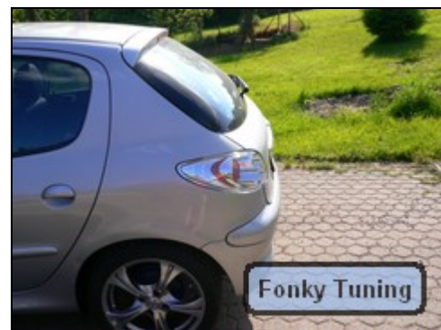
Abb.10 von seitlich nachher

Ist dies geschehen, erfolgt der Einbau in umgekehrter Reihenfolge. Arbeitsaufwand ca.20 min. Ich benötigte zum Umbau einen Schraubendreher und eine Rohrzange. Der Umbau lohnt sich auf jeden Fall. Nur sollte man bei der Quali der Lampen aufpassen. Diese kosteten bei Ebay 65,00 EUR. Jedoch sieht man das auch an der Passgenauigkeit. Ich habe alles hinterklebt, damit der Lack nicht beschädigt wird. Für 120,00 EUR bekommt man diese auch in besseren Online Shops.