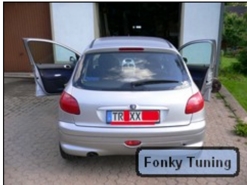
Abb.1 von hinten vorher

Mit dieser Anleitung möchte ich den Anfängern der Tuner erklären, wie man etwas Leichtes, wie etwa die Rückleuchten des 206 umbaut, bzw. auf Klarglas umrüstet.