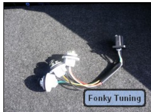
Abb.4 zeigt beiliegenden Kabelbaum

Als Erstes muss die Originallampe ausgebaut werden. Dazu muss zuerst im Kofferraum die Halterung des Teppichs entfernt werden. Dann kann man von Innen an die Lampe heran.