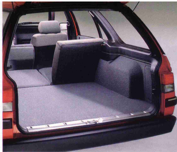
Ladefläche mit geteilt umklappbarer Rücksitzbank