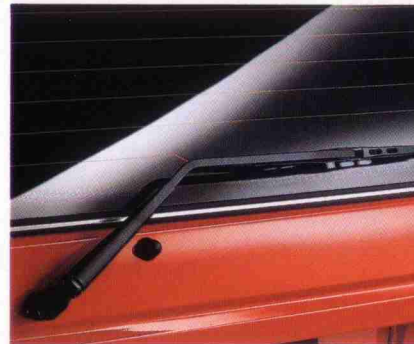
Heckscheibenwischer mit elektrischer Waschanlage