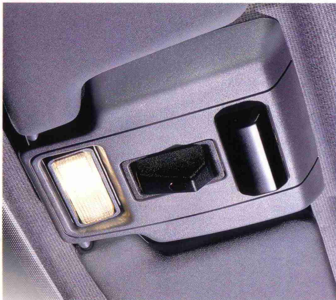
Deckenleuchte vorn mit Kartenleselampe