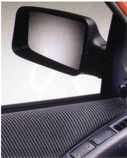
Elektrische Fensterheber vorn und von innen verstellbarer Außenspiegel