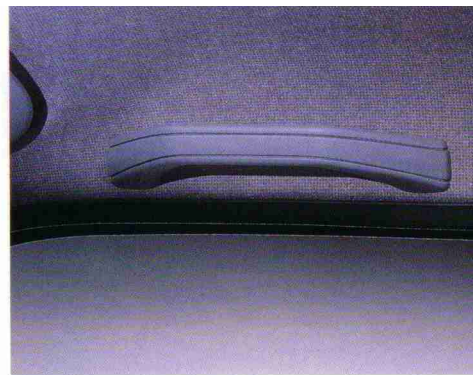
Haltegriff vorn rechts