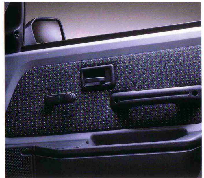
Außenspiegel von innen verstellbar