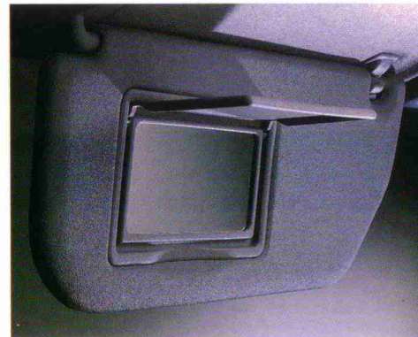
Make-up-Spiegel auf der Fahrerseite