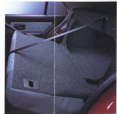
■ Rücksitzbank umklappbar.