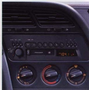
■ Autoradio (Option).