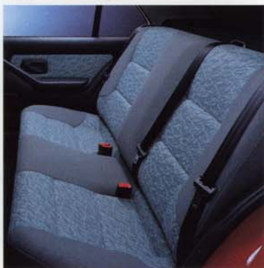
■ 3 Dreipunkt-Automatigurte hinten.