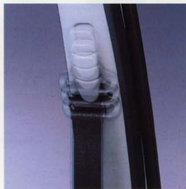
■ Höhenverstellbare Sicherheitsgurte vorn.